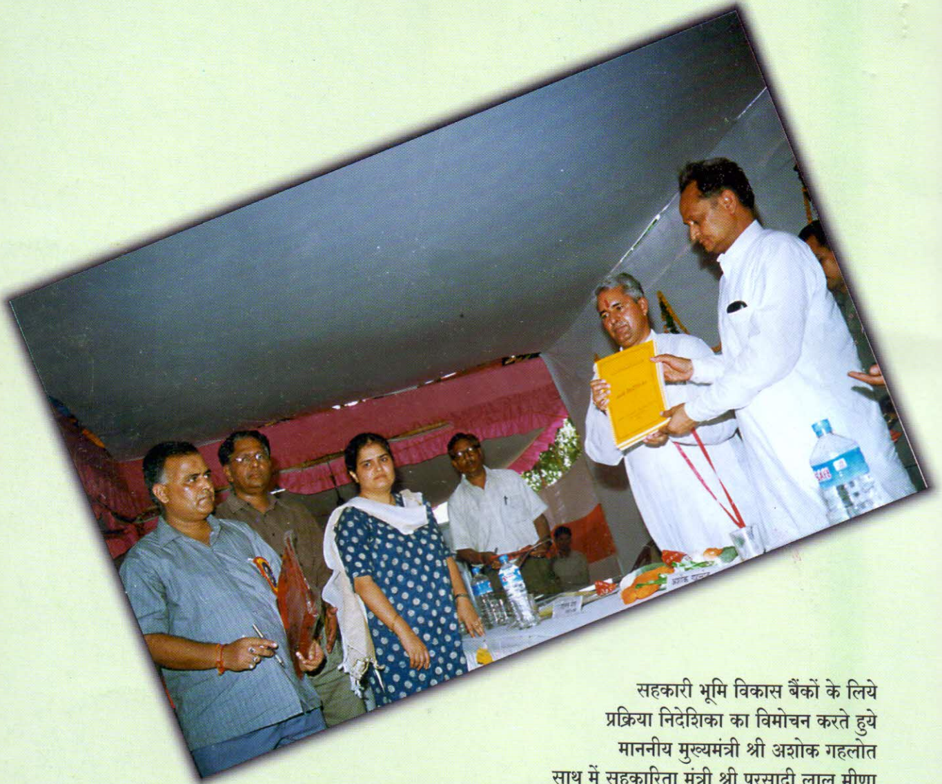
सहकारी भूमि विकास बैंकों के लिये प्रक्रिया निदेशिका का विमोचन करते हुये माननीय मुख्यमंत्री श्री अशोक गहलोत साथ में सहकारिता मंत्री श्री परसादी लाल मीणा